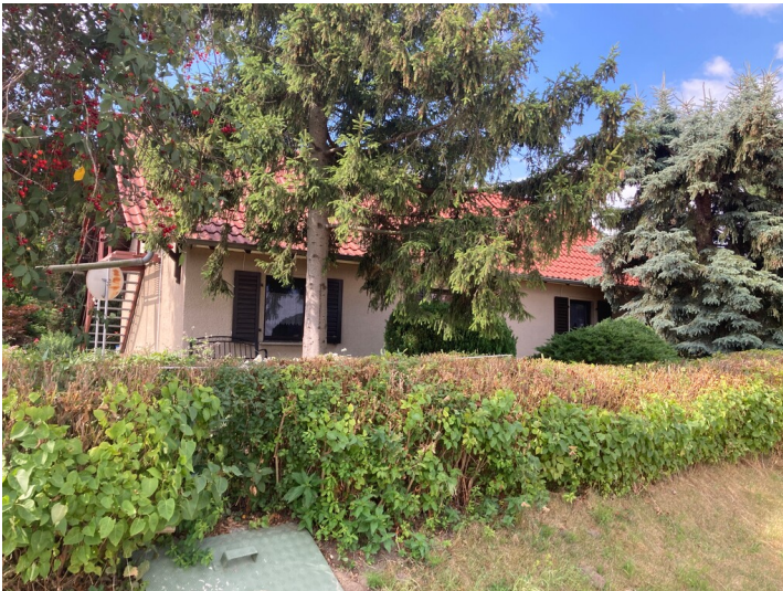
Ausgebaute Wohnbaracke an früherer Flakstellung, Blick nach Südost