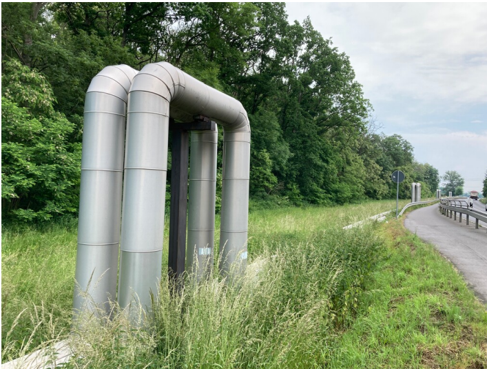
Fernwärmeleitung, Blick nach Südosten entlang der S 71 in Richtung Neukieritzsch