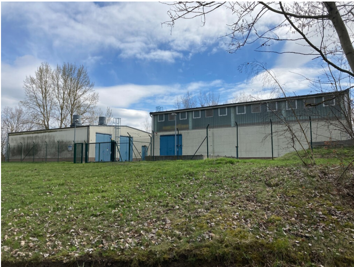
Pumpstation zur Wasserversorgung Kraftwerk Lippendorf, Ansicht von Süden