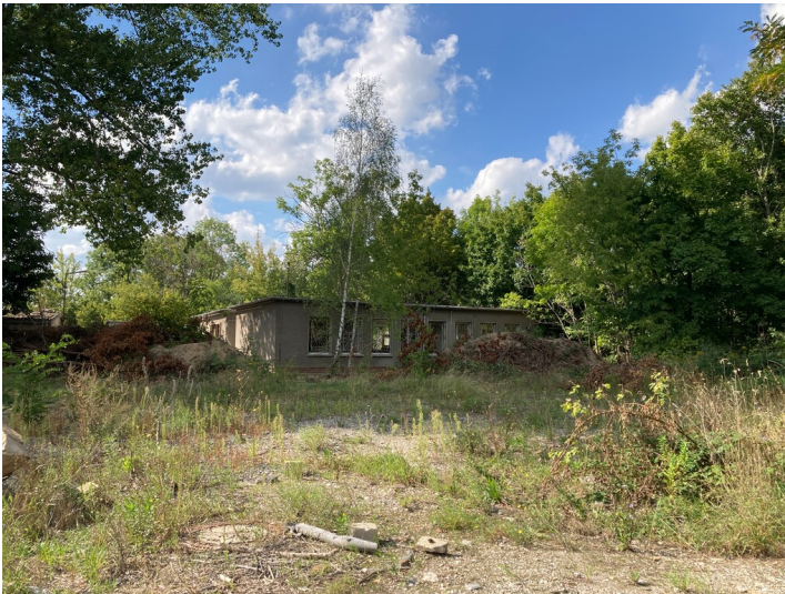
Flachbau, sogenannte Telefonerbaracke, Blick nach Nordwest