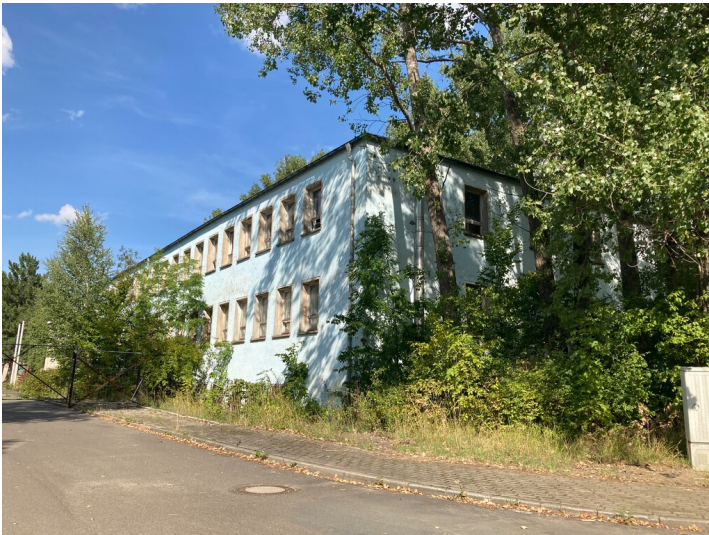
Haus der Kreisleitung, Blick von der Werkstraße nach Nordost