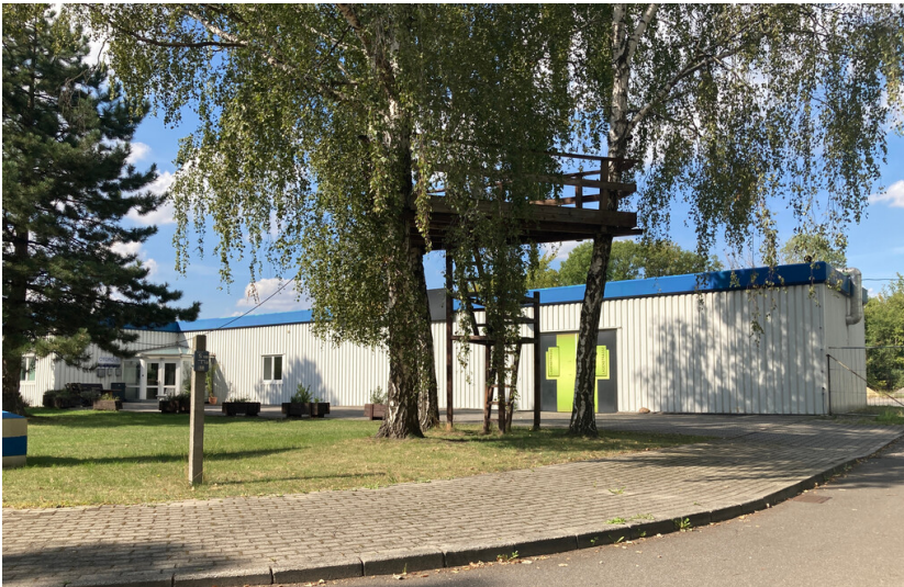
Ladengebäude, Ansicht von der Werkstraße nach Norden