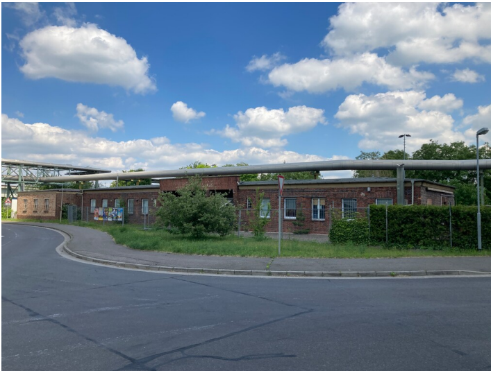
Ladengebäude, Schrägansicht von Südwest