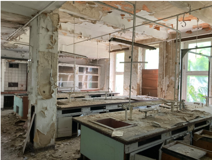
Verwaltungsbau, sogenanntes Laborgebäude, Blick in die Labore