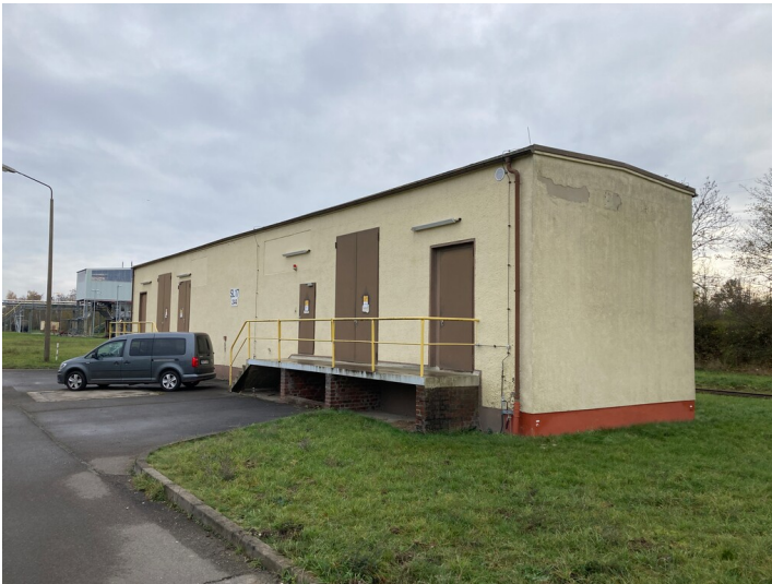
Trafostation, Blick nach Südost