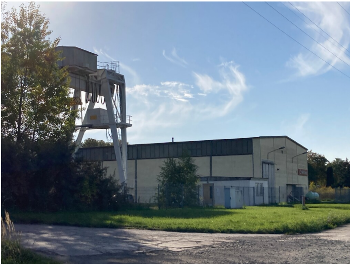
Altkraftwerk Lippendorf, Lagerhalle mit Krananlage; Blick nach Südwest