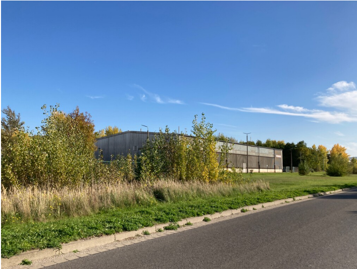
Altkraftwerk Lippendorf, Werk- und Lagerhalle, Blick nach Südost