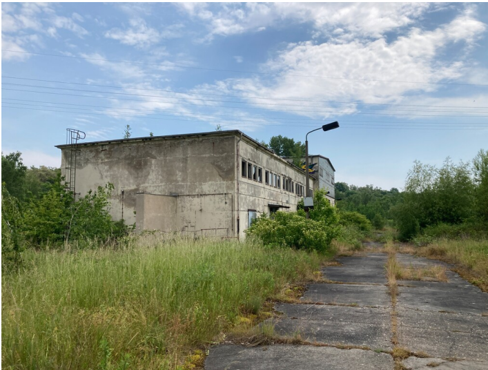
Altkraftwerk Lippendorf, Sozialgebäude mit Laborhalle; Blick nach Südost