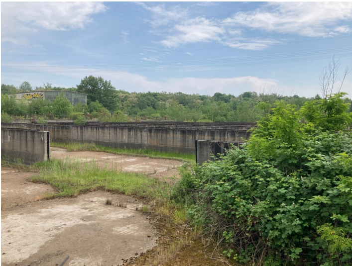
Altkraftwerk Lippendorf, Kläranlage, Blick in die Reinigungsbecken nach Südost in Richtung Halde Lippendorf