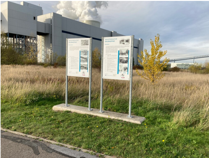
Schautafeln zur früheren Schwelerei und Brikettfabrik am Standort Böhlen-Lippendorf