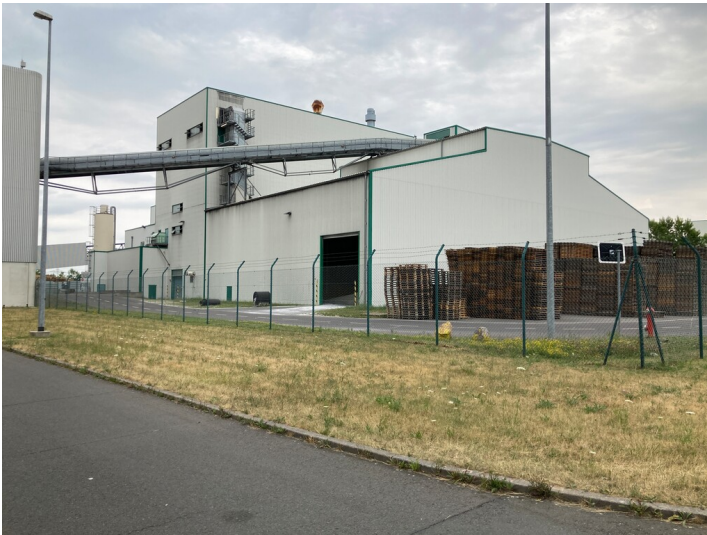
Fabrikhalle Gipsproduktion, Blick nach nach Nordost