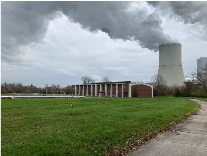
Wasserwerk, Blick nach Osten Richtung Kraftwerk Lippendorf