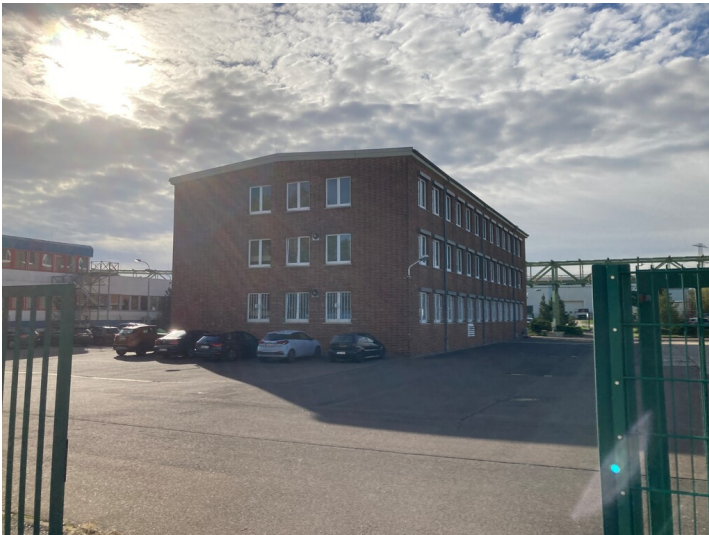
Ehemaliges Belegschaftshaus des Druckgaswerks Böhlen, Blick nach Nordwest