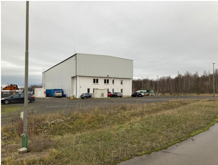
Tagebau Vereinigtes Schleenhain, Werkstattgebäude mit Labor und Öllager, Blick nach Nordwest