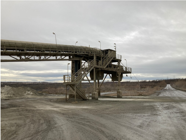
Tagebau Vereinigtes Schleenhain, Verladeanlage für das Trockenaschegemisch zur Tagebausanierung, Blick nach Südwest