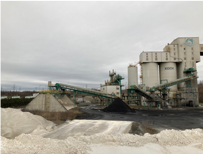
Tagebau Vereinigtes Schleenhain, Lagerplatz für Gips und Nassasche, Blick nach Norden