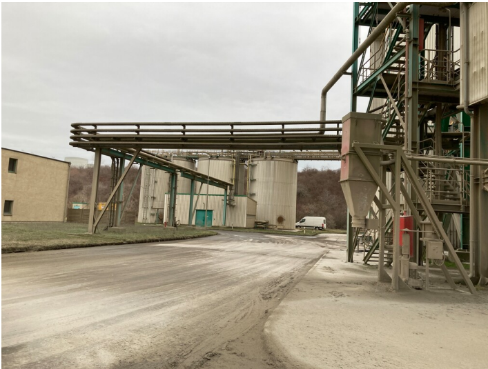
Tagebau Vereinigtes Schleenhain, Restwasserbehälter und Pumpenhaus, Blick nach Nordost