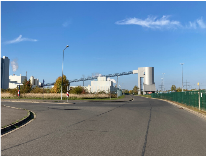
Kraftwerk Lippendorf, Silo- und Verladeanlage an der Güterbahn, Blick nach Norden