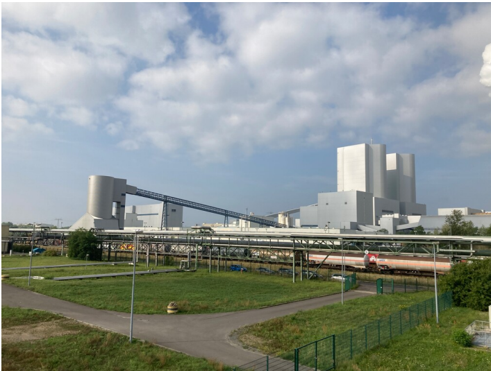
Kraftwerk Lippendorf, Gipstransportbrücke zur Güterbahn, Blick nach Südwest