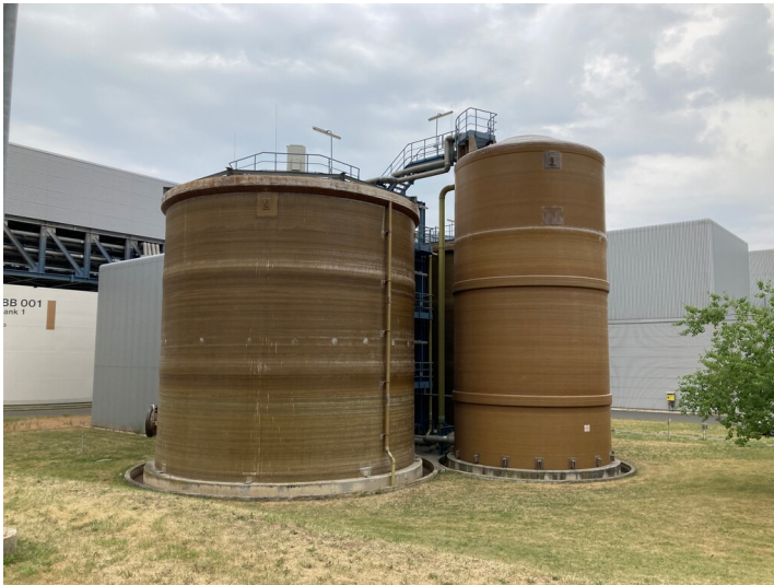
Kraftwerk Lippendorf, Behälter für Ausschleuswasser, Blick nach Nordost