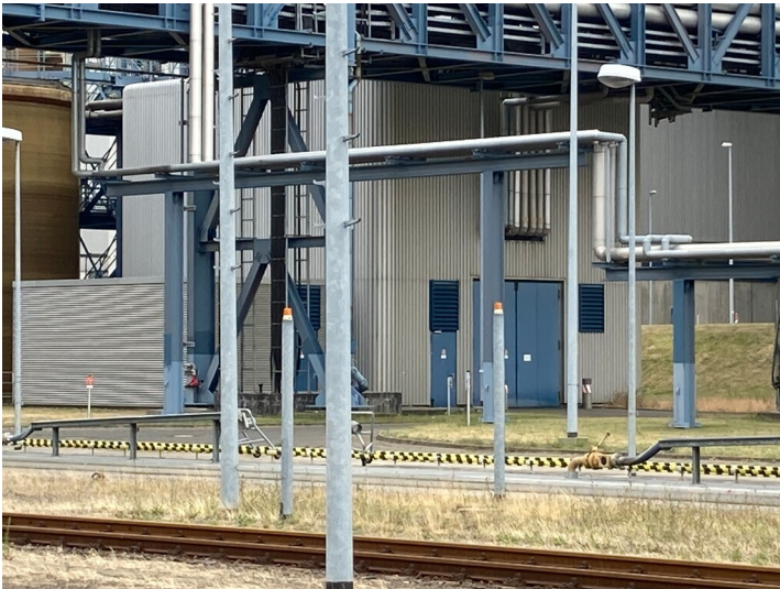
Kraftwerk Lippendorf, Pumpenhaus Ausschleuswasser, Blick nach Südost