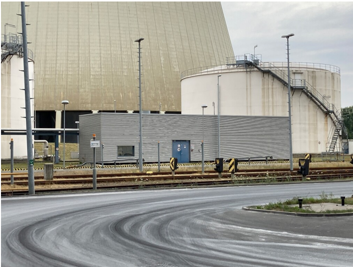
Kraftwerk Lippendorf, Heizölpumpenhaus der Heizölladestation, Blick nach Osten