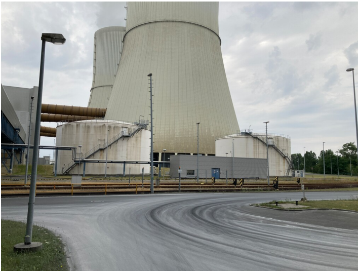
Kraftwerk Lippendorf, Heizölentladestation mit zwei Tanks, Blick nach Westen