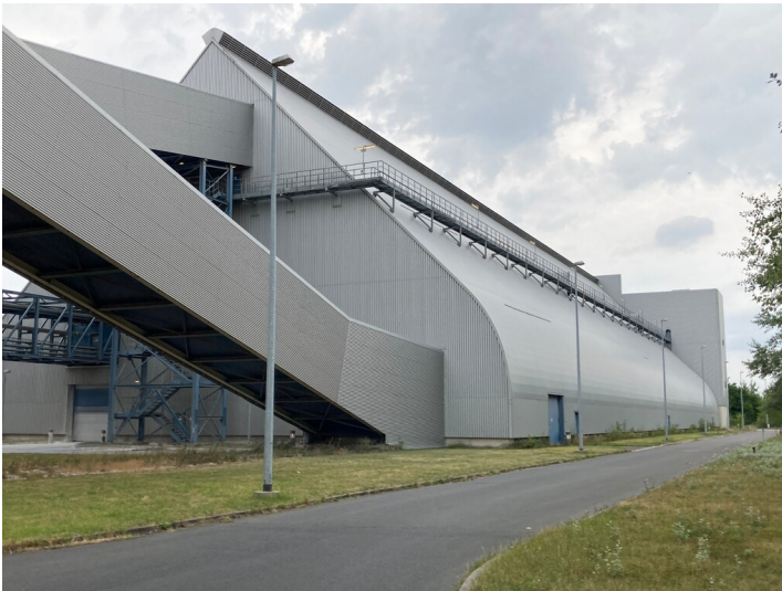
Kraftwerk Lippendorf, Transportbrücke, Blick nach Norden