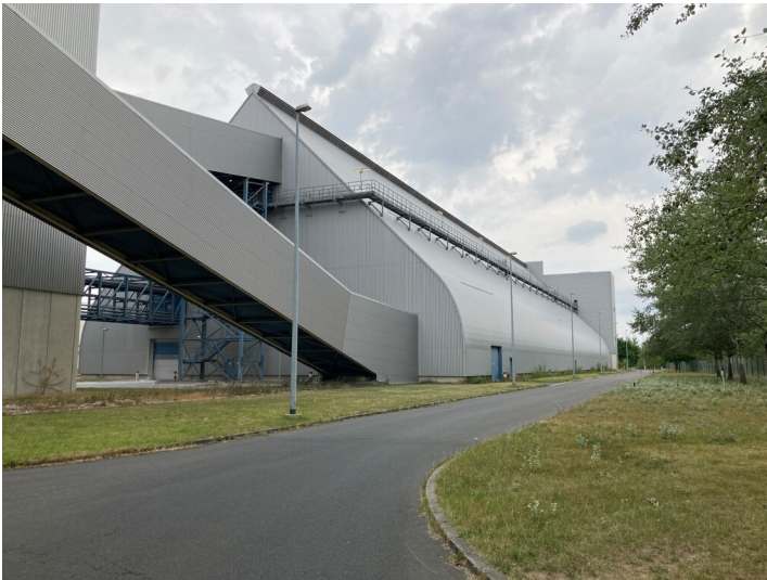
Kraftwerk Lippendorf, Transportbrücke mit Gefälle, Blick nach Norden zur Gipshalle