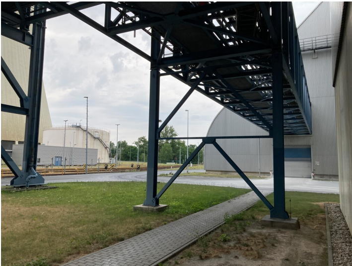
Kraftwerk Lippendorf, Rohrbrücke, Blick nach Norden zur Gipshalle