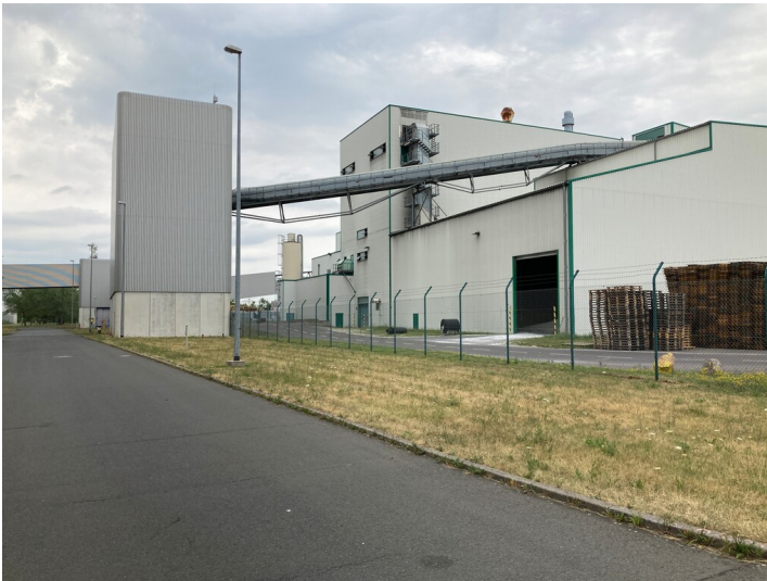
Kraftwerk Lippendorf, Verteilergebäude (Süd) mit Bandförderbrücken, Blick nach Norden