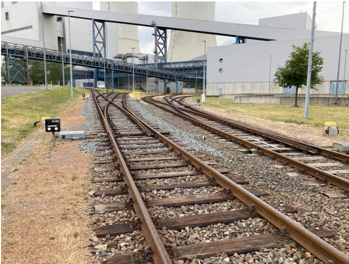
Kraftwerk Lippendorf, Gleisanlagen auf dem Kraftwerksgelände, Blick von Südost