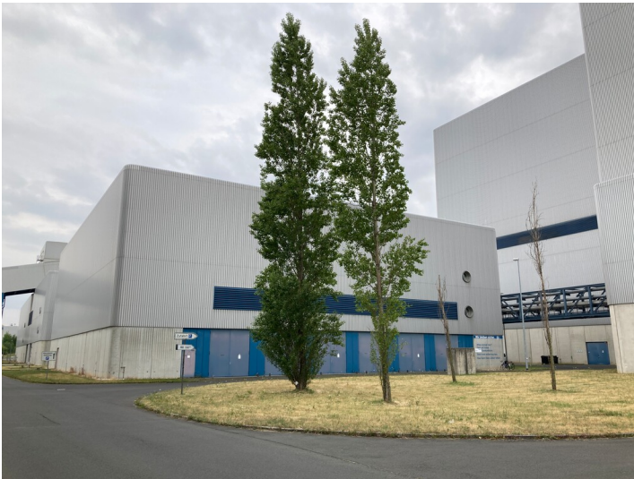
Kraftwerk Lippendorf, Schaltanlagengebäude der Nebenanlagen, Blick von Nordost