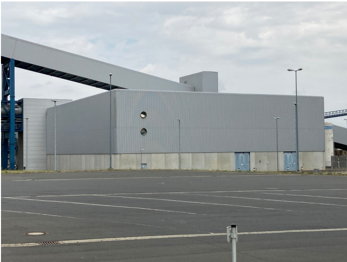
Kraftwerk Lippendorf, Gebäudekomplex der Wasseraufbereitung, Blick von Südwest