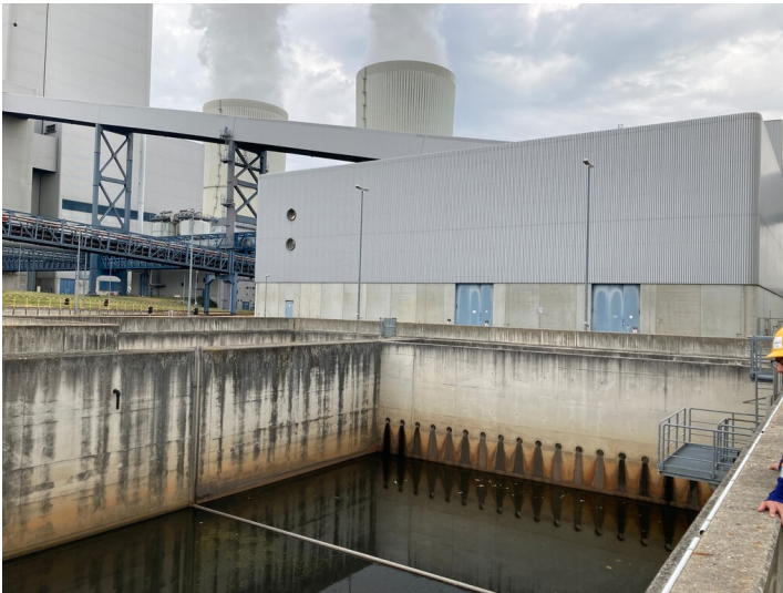
Kraftwerk Lippendorf, Rückhaltebecken für Feuerlösch- und Regenwasser, Blick von Südost