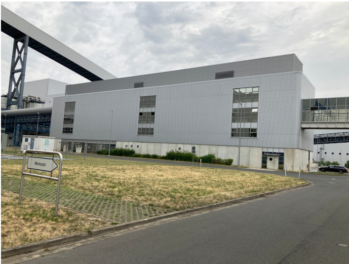
Kraftwerk Lippendorf, Sozialgebäude mit Waschkaue, Blick von Südwest