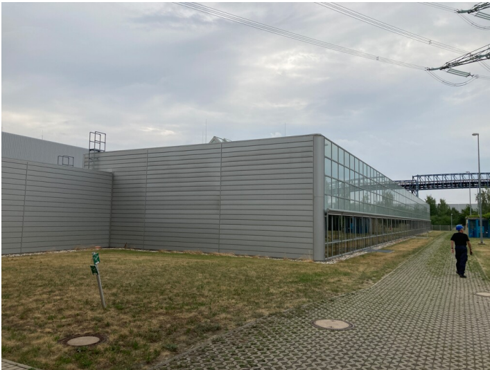
Kraftwerk Lippendorf, Lehrgebäude, Blick von Norden

Schlagwörter: Lehrwerkstatt Fachsicht(en): Denkmalpflege Gemeinde(n): Neukieritzsch Kreis(e): Leipzig Bundesland: Sachsen