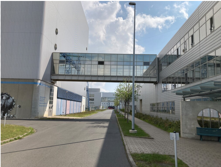
Kraftwerk Lippendorf, östlicher Teil des Eingangsgebäudes, Pförtnergebäude, Rückseite, Blick nach Osten