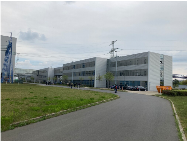
Kraftwerk Lippendorf, Verwaltungsgebäude, westlicher Teil des Eingangsgebäudes, Blick von Nordwest