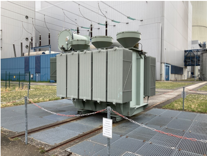
Kraftwerk Lippendorf, mobiler Fremdnetz-Trafo auf Gleisen und Absetzfundamenten, Blick von Südost