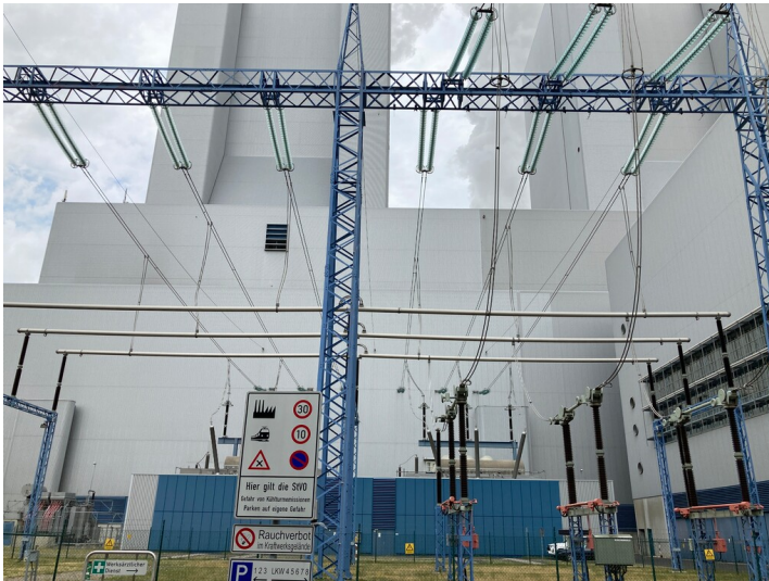
Kraftwerk Lippendorf, Maschinenabspannfeld der 380-kV-Umspannanlage, Blick von Süden