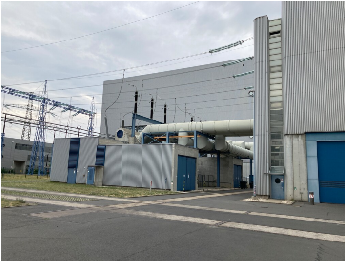
Kraftwerk Lippendorf, Umspannstation 380-kV-Anlage, Blick von Nordost