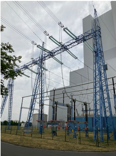
Kraftwerk Lippendorf, Maschinenabspannfeld der 380-kV-Umspannanlage, Blick nach Norden

Schlagwörter: Transformator Fachsicht(en): Denkmalpflege Gemeinde(n): Neukieritzsch Kreis(e): Leipzig Bundesland: Sachsen