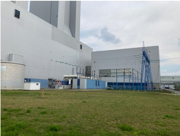
Kraftwerk Lippendorf, Umspannstation 380-kV-Anlage, Blick von Südwest