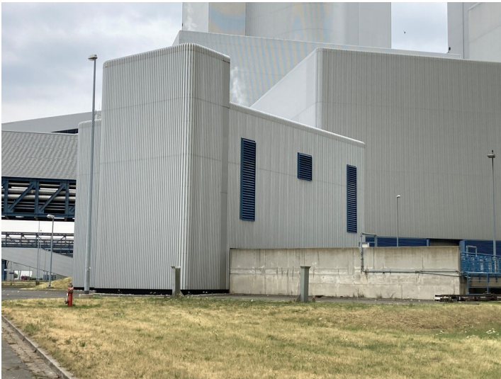
Kraftwerk Lippendorf, Kühlwasserpumpenhaus S, Blick von Nordost