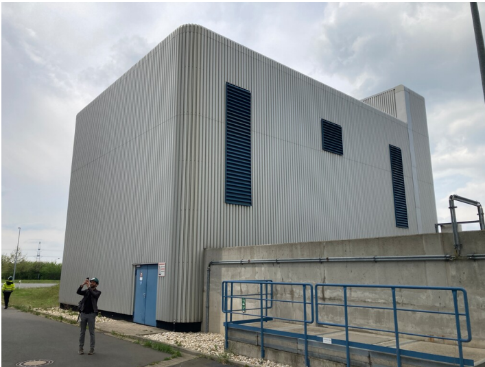
Kraftwerk Lippendorf, Kühlwasserpumpenhaus R, Blick von Osten