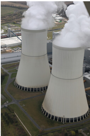
Kraftwerk Lippendorf, Naturzug-Nasskühlturm R und S, Schrägluftaufnahme