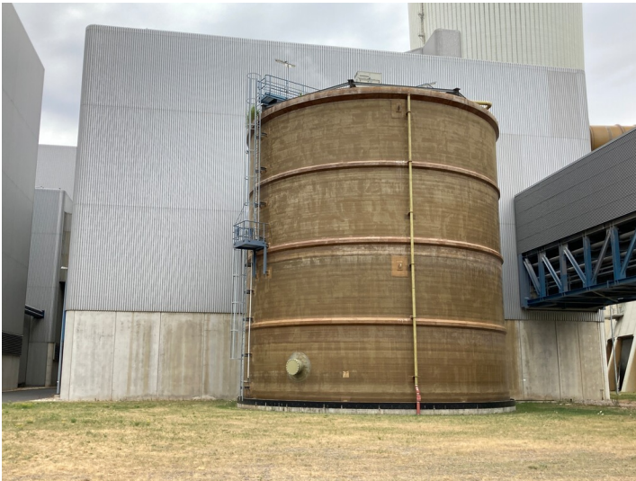
Kraftwerk Lippendorf, Entleerungsbehälter an Ostseite der Rauchgasentschwefelungsanlage