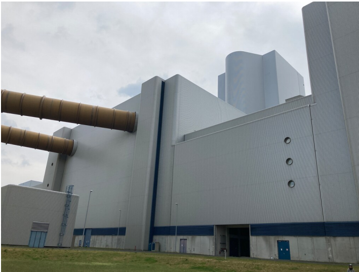
Kraftwerk Lippendorf, Rauchgasentschwefelungsanlage, Blick von Nordwest auf mittigen Gebäudeteil mit Schaltanlagen