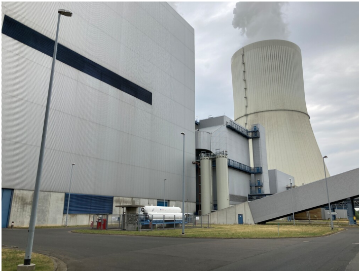
Kraftwerk Lippendorf, östliches Kesselhaus (Dampferzeuger S), Blick von Südost